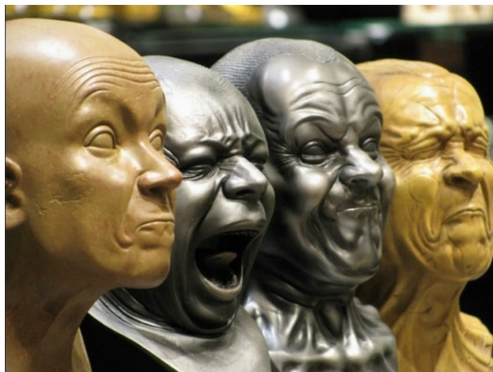
2. Espressioni delle emozioni: le teste di carattere. scultura di F. X. Messerschmidt

mondo, nascerà il sottotesto , ovvero ciò che immaginiamo possa essere accaduto prima o dopo la vicenda rappresentata dal personaggio che l'attore andrà ad interpretare. L'attore userà così la propria memoria emotiva stabilendo analogie tra la sua personale sensibilità e quella del personaggio, entro un continuo scambio vitale. L'attività immaginativa messa in moto dall'attore si specifica e si precisa, eliminando ciò che è inutile. Nella perenne riattivazione, tra immaginazione e realtà, l'attore includerà il personaggio che egli stesso ha saputo ricercare al suo interno. La tecnica specifica, il metodo , introdotto da Stanislavskij, impegna l'attore ed il regista che lo guida, in un arduo e prolungato lavoro che va oltre al coinvolgimento delle prove tradizionali, arriva ad invadere nel profondo la vita stessa degli artisti e comporta una rivoluzione dei modi e delle consuetudini proprie della prassi teatrale fine ottocentesca.