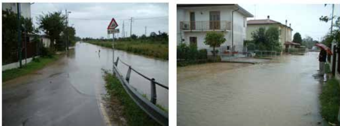
Figura 4 – Mogliano Veneto, alluvione Settembre 2006 – Immagini di Allagamento di strade per esondazione del canale Peseggiana (AVPC)

I Piani Comunali di Protezione Civile devono indicare quali possono essere le aree alluvionali e le zone critiche, al fine di consentire una migliore gestione delle emergenze ossia dare degli indirizzi ai cittadini per aiutarli a prevenire e affrontare al meglio la situazione di emergenza, ricordando loro dei punti fondamentali: