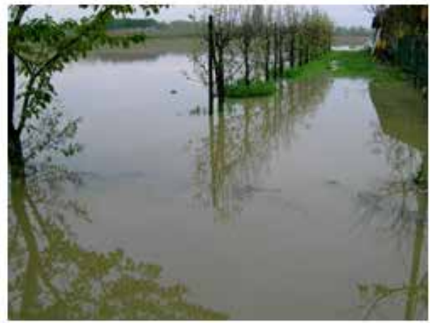
Figura 1 - Immagini dell'alluvione avvenuta a Mogliano Veneto, novembre 2005 (AVPC)