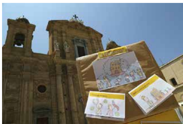
Figura 11 – Esempio di "Totem"

( https://twitter.com/iononrischio/status/ )