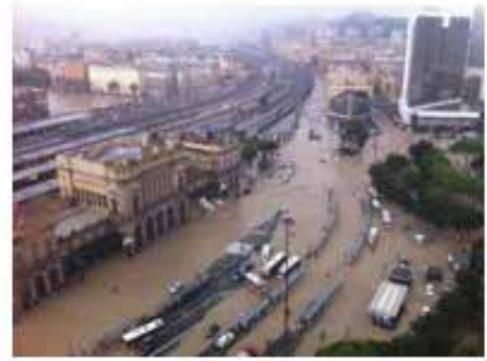
Figura 2 - Immagini dell'alluvione di Genova, novembre 2011 ( https://www.meteoweb.eu/tag/alluvione-genova/ )