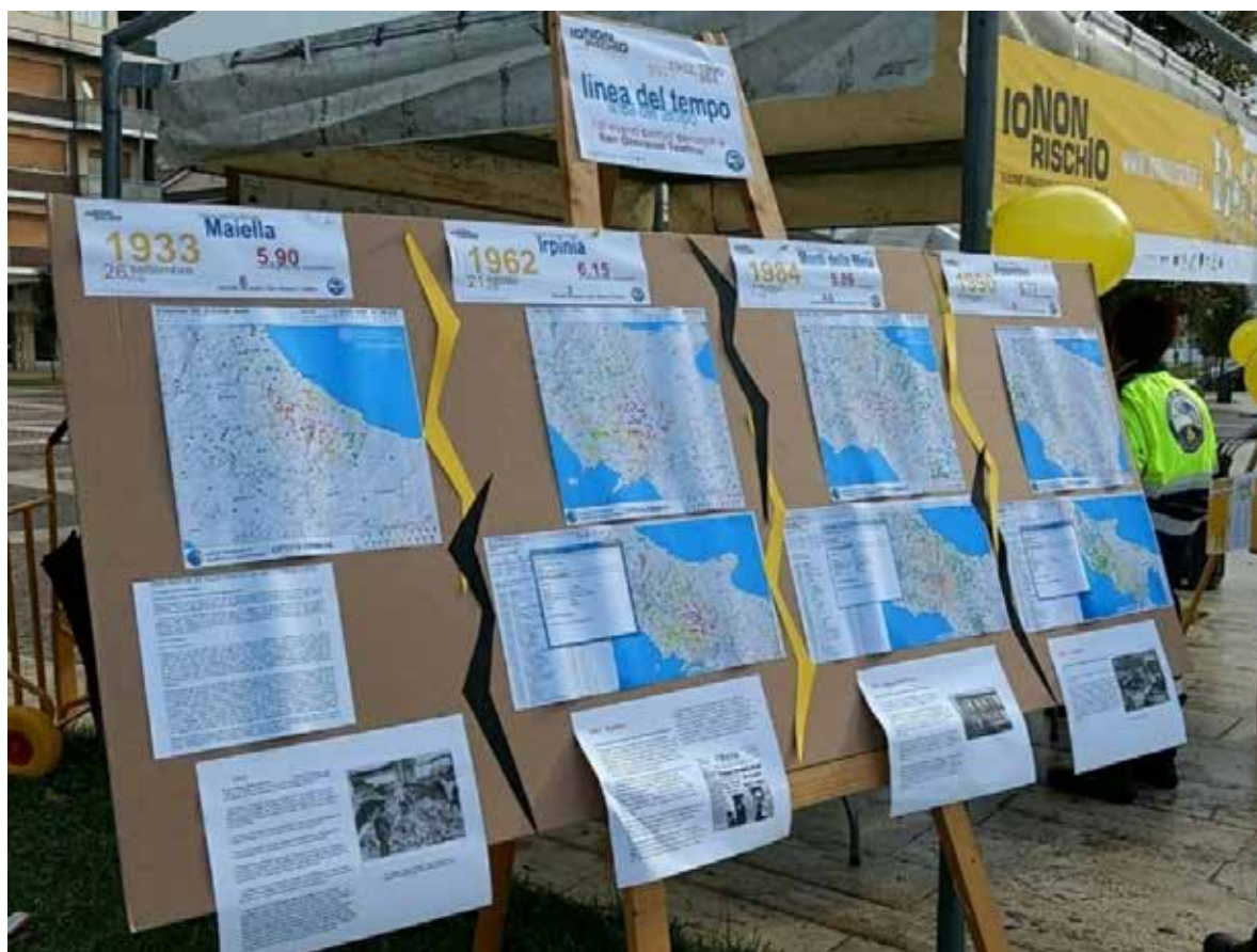
Figura 8– Esempio di “Linea del tempo”

( https://twitter.com/nucleovolontari/status/ )