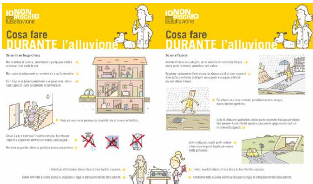
Figura 13 – Esempio di “Scheda” (6)

La campagna INR non prevede particolari percorsi per i bambini. Potrebbe essere interessante predisporre uno spazio per loro, alla presenza di un giovane volontario intrattenitore, ad esempio con la rappresentazione di scenari di protezione civile da colorare e giochi, mentre i “grandi” sono coinvolti in discorsi più complicati.