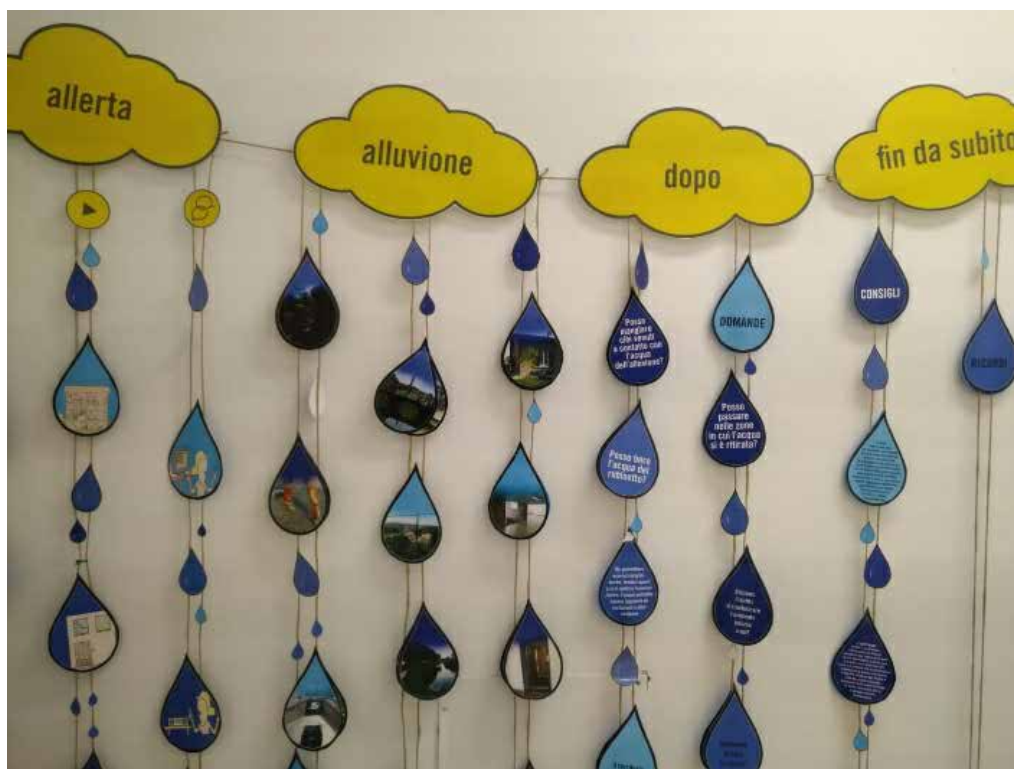
Figura 9 – Esempio di “Tenda alluvione”

( https://www.pronaturabologna.it/protezione-civile/prevenzione/io-non-rischio/ )