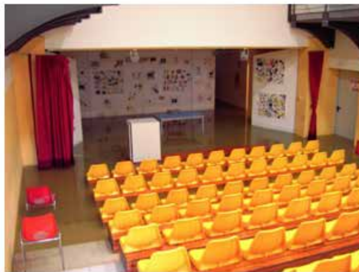
Figura 3 – Mogliano Veneto, alluvione Novembre 2005 – Auditorium della Scuola Media allagato per rientrata d'acqua dal canale Fossa Storta in vicinanza (AVPC)