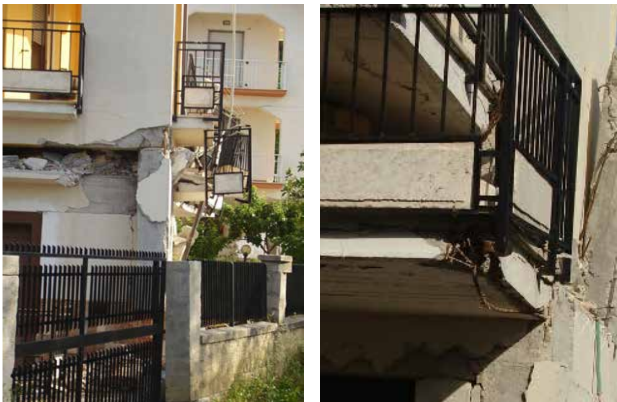
Figura 6 – Immagini di danni strutturali causati dal terremoto dell’Aquila, 6 aprile 2009 (AVPC)