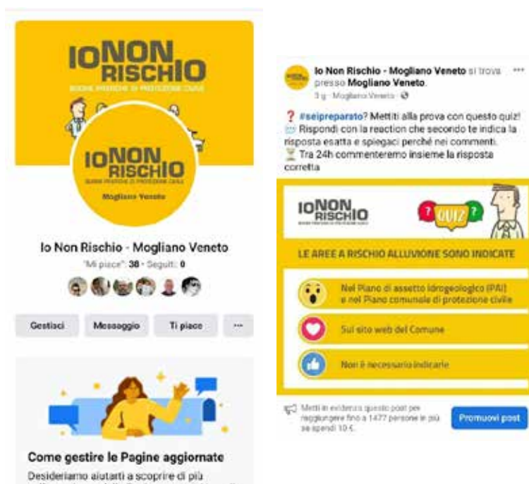
Figura 7 – Esempio di Pagina Facebook (AVPC)

Nella figura seguente un esempio di pagine Facebook realizzata per conto di AVPC nell'ambito del lavoro di stage .