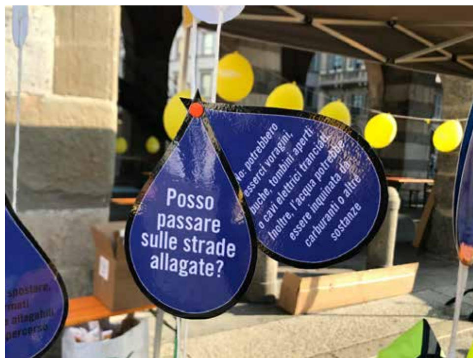
Figura 10 – Esempio di “Tenda alluvione” - Dettaglio

( https://www.pronaturabologna.it/protezione-civile/prevenzione/io-non-rischio/ )